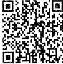
หนังสือที่อ้างถึง