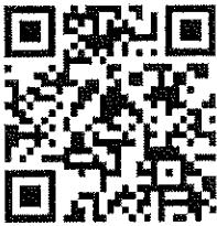
สิ่งที่ส่งมาด้วย

รองอธิบดี ปฏิบัติราชการแทน อธิบดีกรมส่งเสริมการปกครองท้องถิ่น